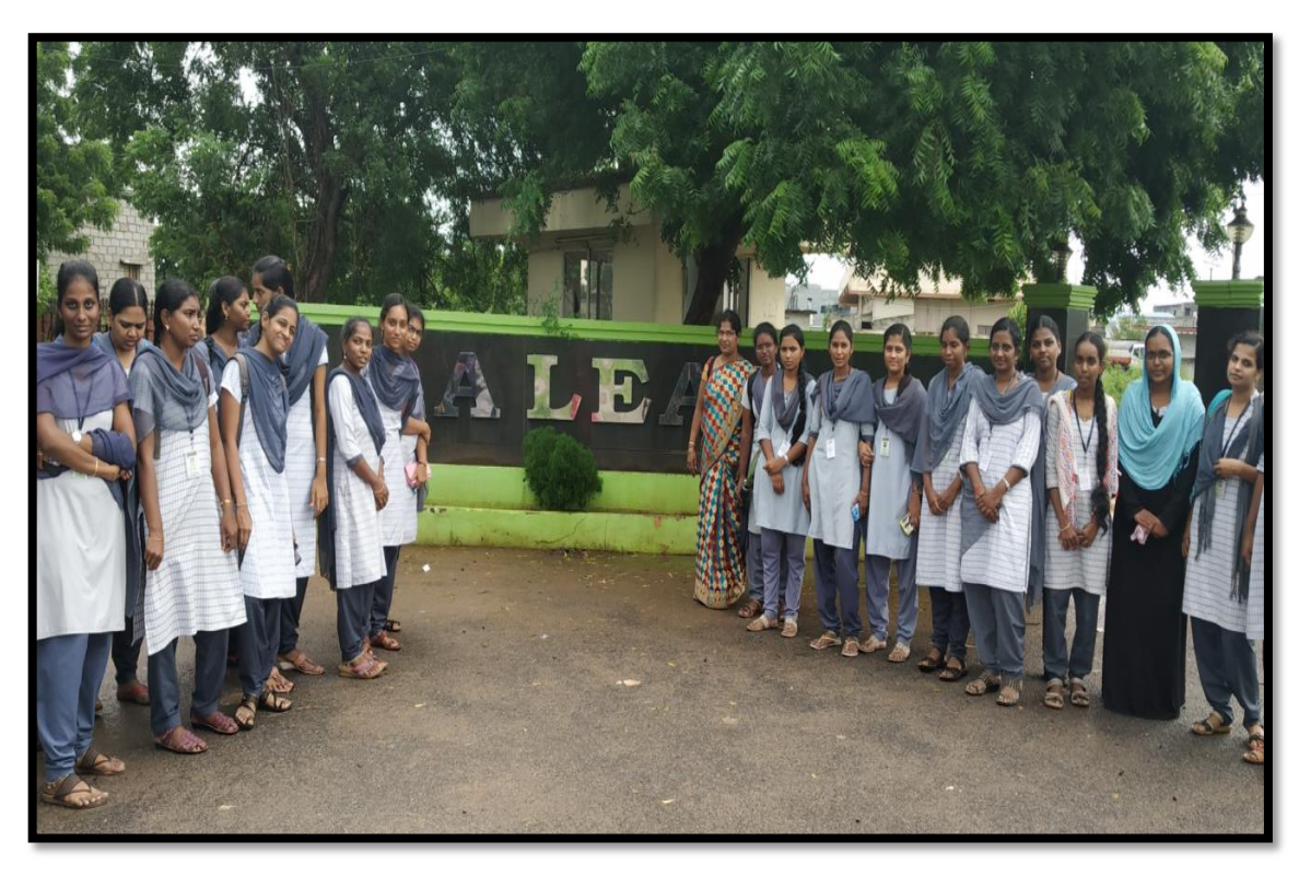
Field Trip to Industrial area ALEAP, Surampalli